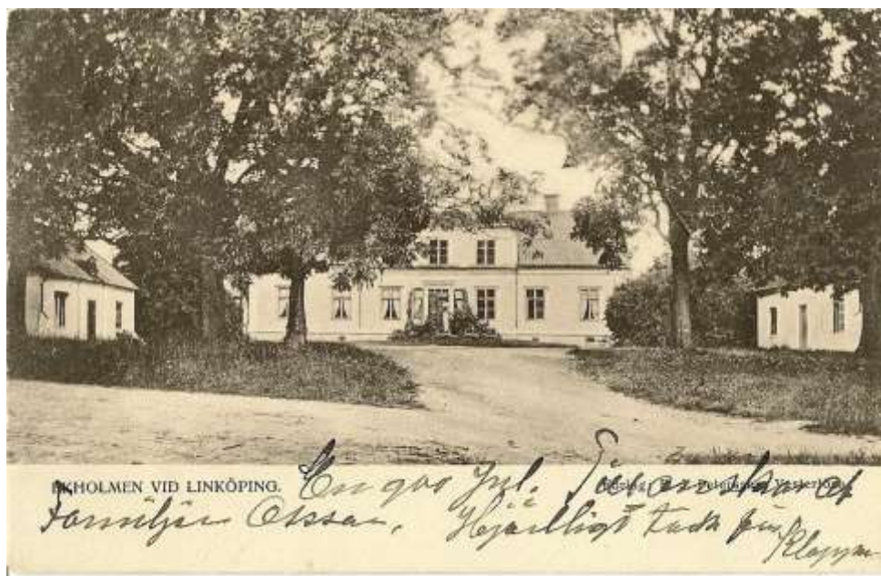
Vykort från Ekholmens Gård 1911