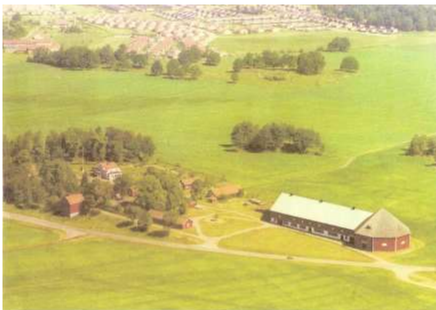
Flygbild från mitten av 1960-talet över Blästrad och Ekholmen. Blästad Gård och Vistvägen syns i förgrunden.