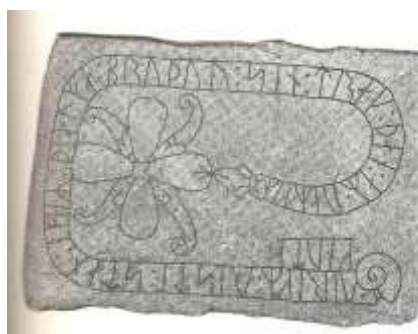
Landerydsstenen i tornrummet i Landeryds Kyrka

När ni tar en kvällspromenad i sommar besök gärna fornborgen som ligger ca 500 meter in på Uvebergsvägen från Brokindsleden, eller gå till Landeryds kyrka och titta på den runsten som finns inmurad i tornhuset.